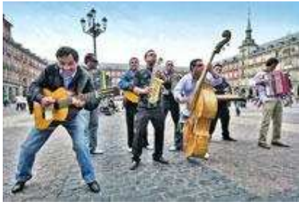
MUSIKK OG HISTORIE: Plaza Mayor var og er sentrum for musikanter og andre innslag. I nesten et halvt årtusen har livet og døden danset sammen på denne plassen. Offentlige henrettelser, tyrefekting, torgkoner, lommetyver og musikanter.