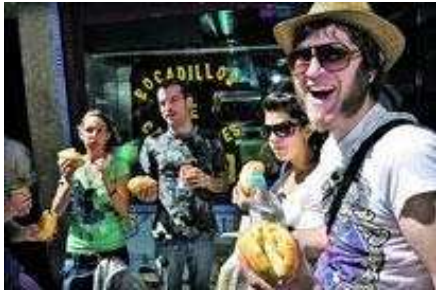
KUNSTEN Å NYTE: På Plaza Mayor står en gjeng fra Mallorca og jafser i seg bocadillo de calamares, bagett med miniblekksprut. Da er livet bokstavelig talt godt.