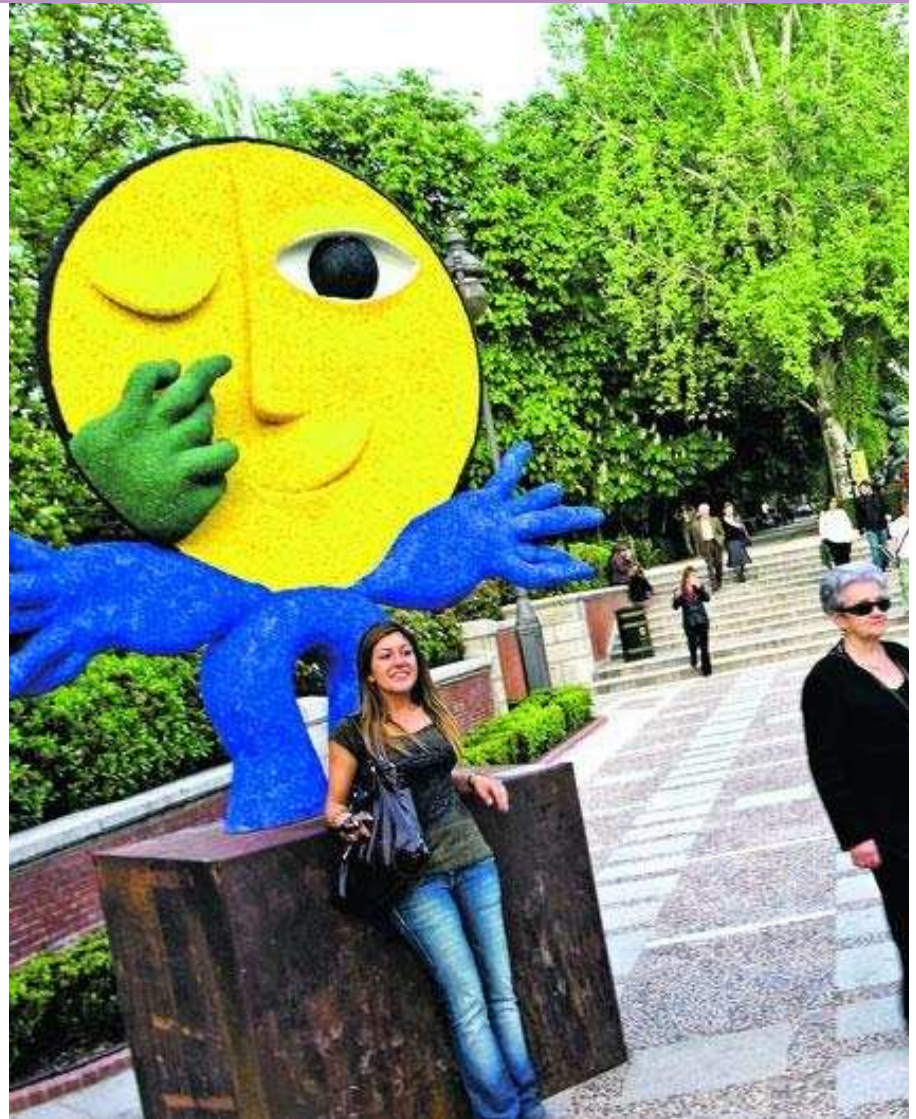
UNIVERSO URBANO: I Retiro-parken finner vi disse snodige, glade figurene. Barn og voksne klyver stillingen «Universo Urbano».

land, eller Paris med Frankrike. Men Madrid er så spansk, alle Spanias klisjeer og stereotypier lever sammen her, sier han.