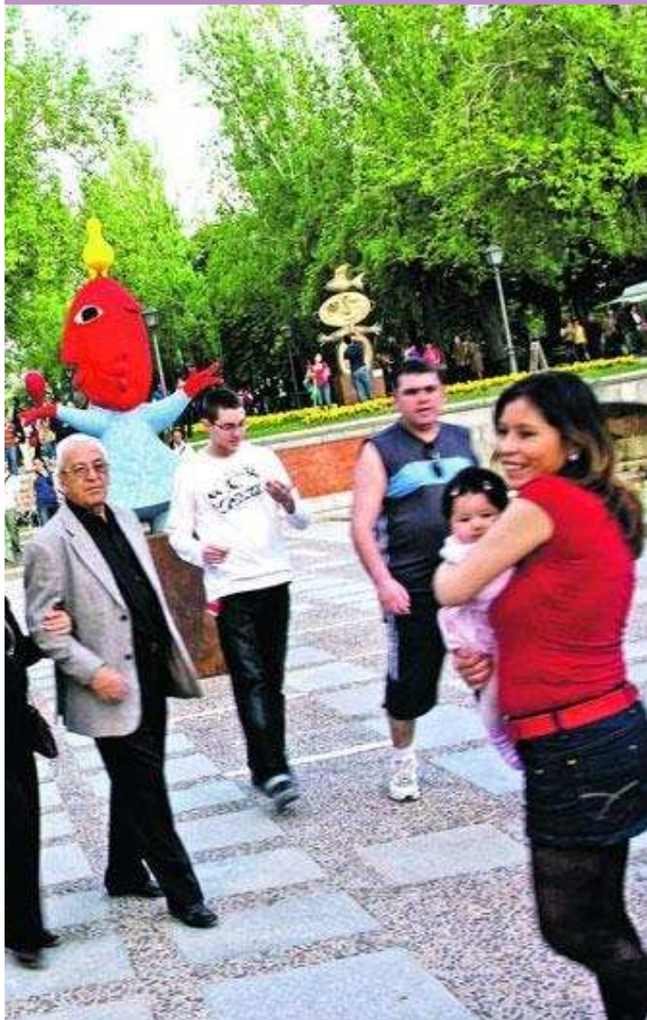
rundt i dem, knipser bilder og snuser blant de 21 lykkelige kunstverkene i ut-

møter vi metromusikere i byens undergrunnssystem. De spiller sine trekkspill, trompet, syntner og fioliner for et evig vekslende publikum.