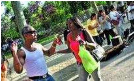
PARKLYKKE: På søndager møtes man i El Parque del Buen Retiro, gateartistenes og parkkunstens rike.