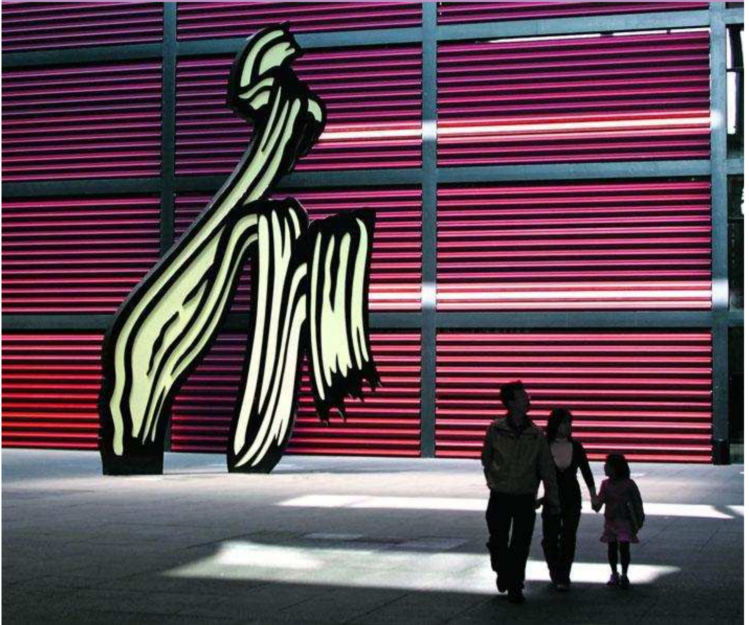
rundt i en kulturell oase. Du starter turen på Plaza Nouvel ved en av utgangene til Reina Sofía-museet for moderne samtidskunst. Den ligger på Paseo del der tre av verdens beste museer befinner seg.

hovedstad. En by skapt på tilrøvet makt, en historie om grådige regenter og om de små livskunstnere som levde så inderlig i dens gater.