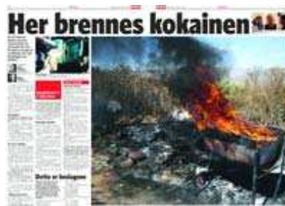
Dagbladet 25.05.2008. Her går kokainen som de norske jentene er mistenkt for å ville smugle, opp i røyk.