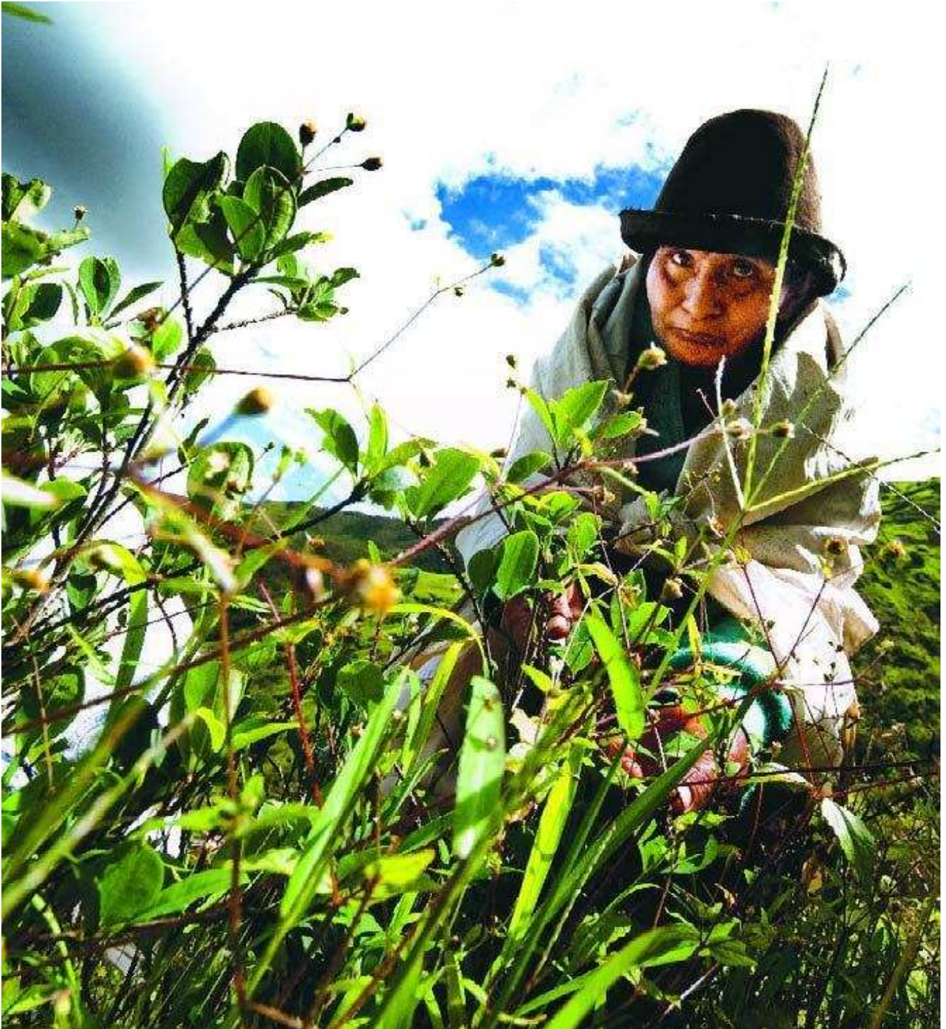
Livsgrunnlag: - Jeg har levd av kokaplantene siden jeg var liten, forteller kvinnen som plukker kokablader i høyden over San Jacinto i Yungas. Kvinnene står for innhøstingen. Mennene fjerner ugresset mellom kokabuskradene.