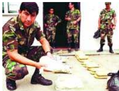
Beslaglagt: Ja til koka, men nei til kokain, er mantraet i presidentpalasset i La Paz. På fjorårets ti første måneder hadde myndighetene beslaglagt 428 625 kilo narkotika. Her fra Chapare-distriktet, berømt for sin storstilte narkotikaproduksjon.