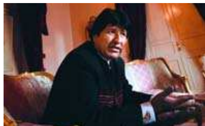
Kokabonde: President Evo Morales (47) kommer fra en kokabondedefamilie og vil legalisere koka-dyrkingen. - Vi har ikke en tradisjon for å bruke narkotika i Andes, sier han.

som hvite; de øvrige er aymara-, quechua-, og guaraní-folk eller mestiser. Det ble en voldsom protestbølge i Bolivias rikeste regioner da han ville endre landets konstitusjon, men mange bønder uttrykker glede over at de endelig er representert i presidentpalasset. Han fikk da også 80 prosent av stemmene ved valget i 2005.