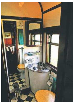
LUKSUS-DO: Togkupeene er velutstyrte. Fliser på gulvene og nostalgiske paneler overalt.