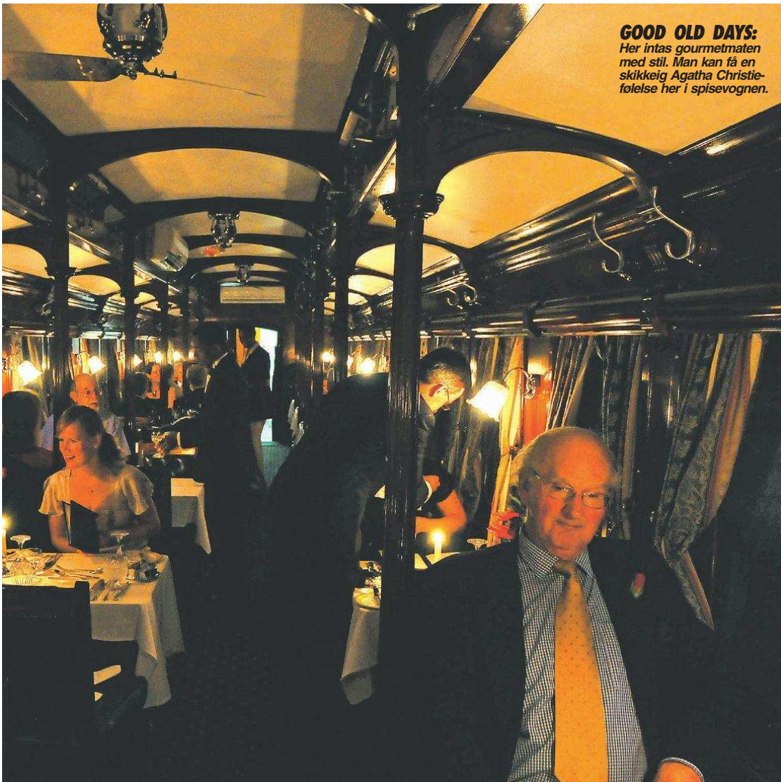
GOOD OLD DAYS: Her intas gourmetmaten med stil. Man kan få en skikkeig Agatha Christie-følelse her i spisevognen.